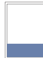
1/4 Seite quer 220x72 mm

Anzeigenplatzierung nur im Satzspiegel möglich.