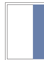
1/3 Seite hoch 76x310 mm