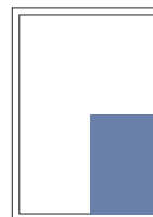
1/4 Seite hoch 107x150 mm