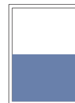
1/2 Seite quer 220x150 mm