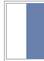
1/2 Seite hoch 107x310 mm